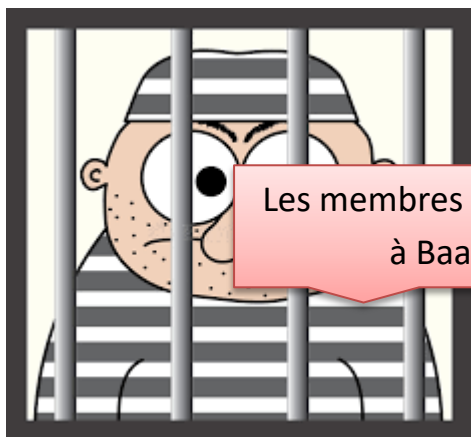
Les membres de la bande à Baader